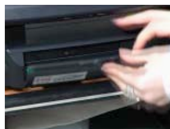
Démarrage par la trappe 'accès.

Sa valise de transport permet de déplacer l'Explorateur de Métiers avec facilité, selon un maximum de protection pour un meilleur confort.